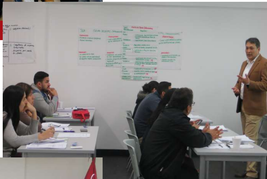
Capacitación en Sistemas Integrados de Gestión ISO 9001, ISO 45001, ISO 14001.