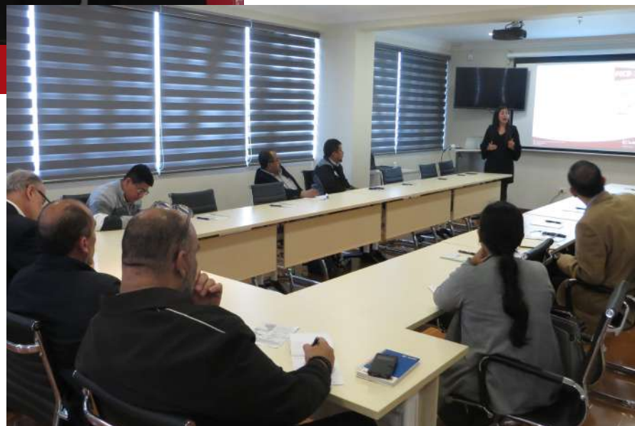
Workshop sobre la Certificación PECB-Canadá.