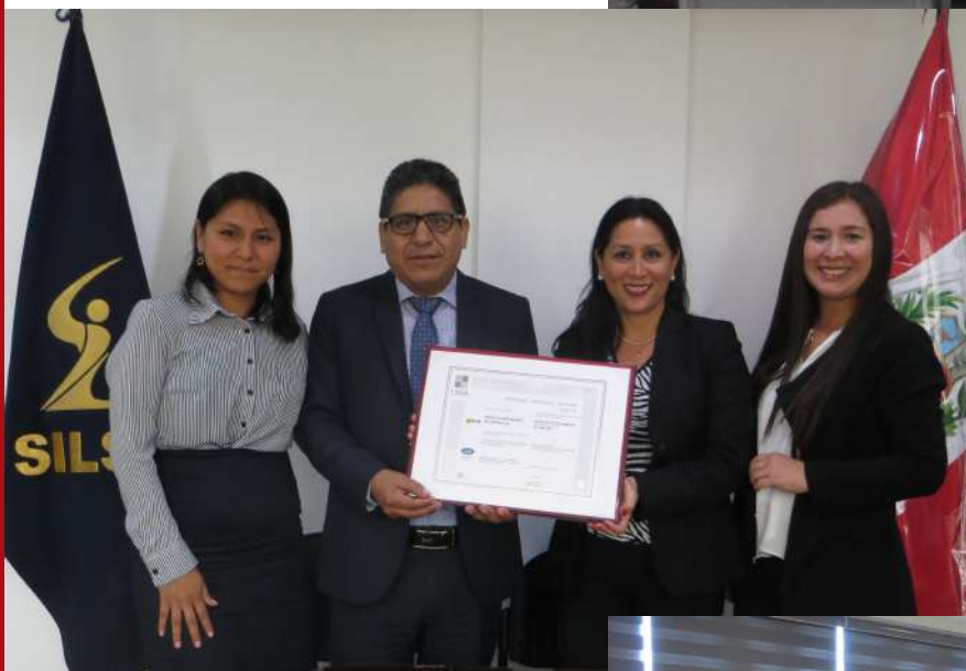
Se logró Certificación en SILSA, gracias a consultoría en ISO 14001.