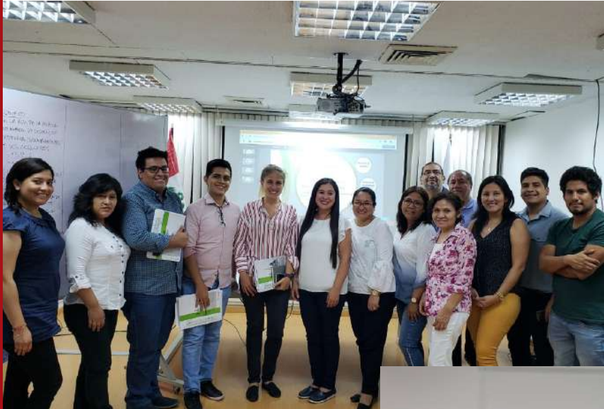
Capacitación a PRONIED del Ministerio de Educación.